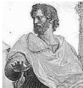
Aristóteles de Estagira.